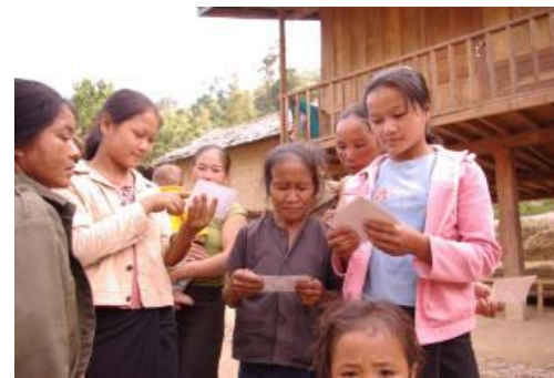
Village khamu de la région de Pakbeng (4 ème de couverture)

pour les mises à jour ultérieures du livre. Plutôt qu'un classement chronologique, ces rappels sont regroupés par villages.