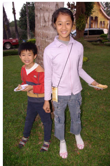
Ces enfants figuraient page 226 du livre, avec une collection de livres en français. La photo datait de 2006 ; ils ont grandi depuis et ils étaient ici en décembre 2008, à la biennale de l'image de Luang Prabang, avec leurs parents (ci-dessus à gauche). Cette autre enfant à droite se reconnaîtra avec son lexique franco-lao, reçu lors d'un déjeuner avec Manivanh T.