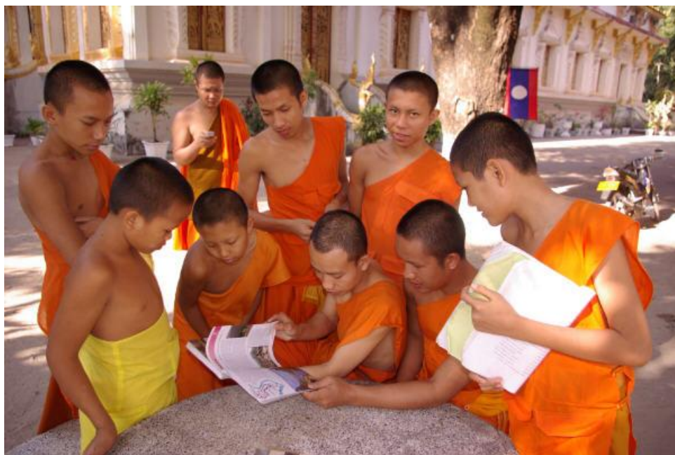
Ces jeunes moines sont ceux de la page 135 du livre. Ils étaient en prière après le takbat ce matin-là de février 2007. Lors de cette réunion de novembre 2007, ils ont voulu parcourir tout le livre et se faire expliquer le site de chaque photo dans un anglais correct. L'entrée de ce vat est située à Vientiane tout près de la Carterie du Laos dans la rue Setthatirat.