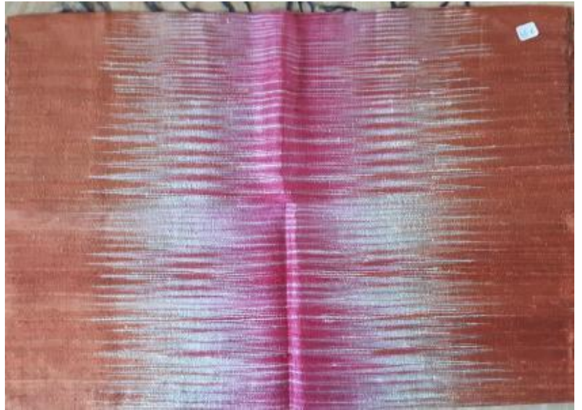
N°14 foulard SAUMON soie Ikat 60 x 170 - 45 €