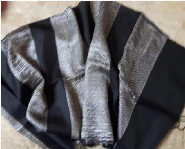
N° 12 foulard FOND NOIR soie sauvage 41 x 160 - 24 €