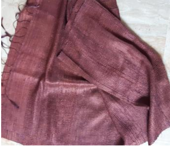
N° 12 foulard BORDEAUX soie sauvage 41 x 160 - 24 €