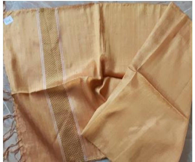
N° 12 foulard BOUTON D'OR soie 41 x 160 - 24 €