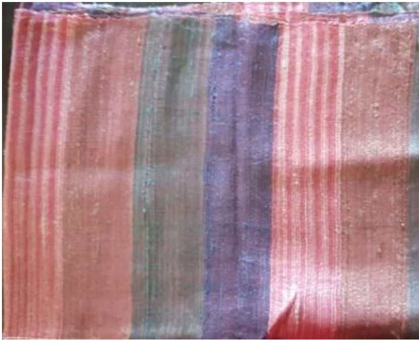
N°13 foulard SAUMON-MAUVE soie sauvage 60 x 170 - 35 €