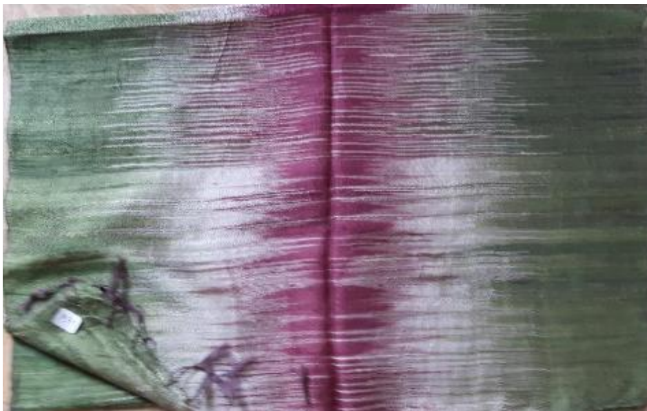
N°14 FOULARD SOIE 60 X 170 - 45 €