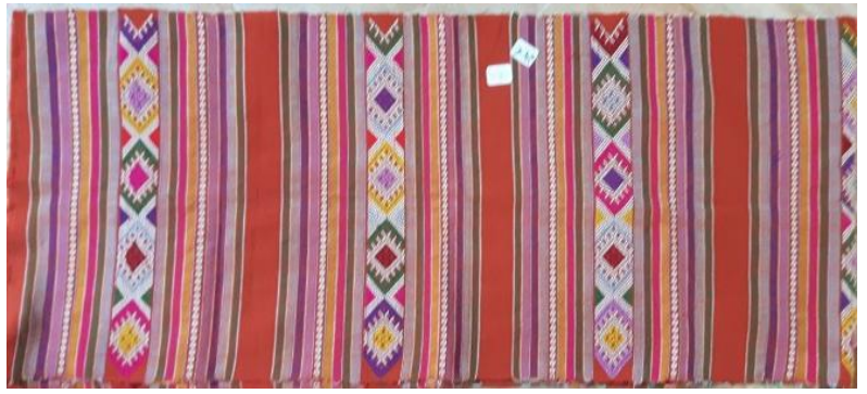
N° 11 foulard ou centre de table coton belles broderies 32 x 150 - 24 €