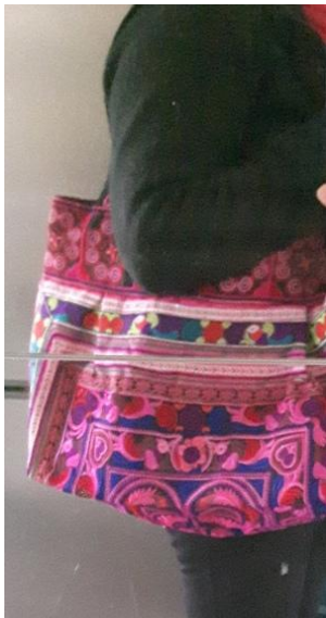
N° 23 grand sac flowers fuchsia 30 x 50 - 30 €