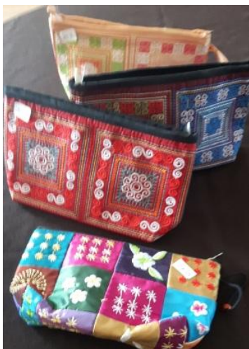
N° 29 trousse soie 23 x 12 - 10 €

Disponible à Vouvant, sauf vente entre-temps.