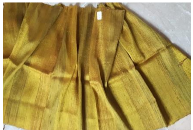
N° 12 foulard OR soie sauvage 41 x 160 - 24 €